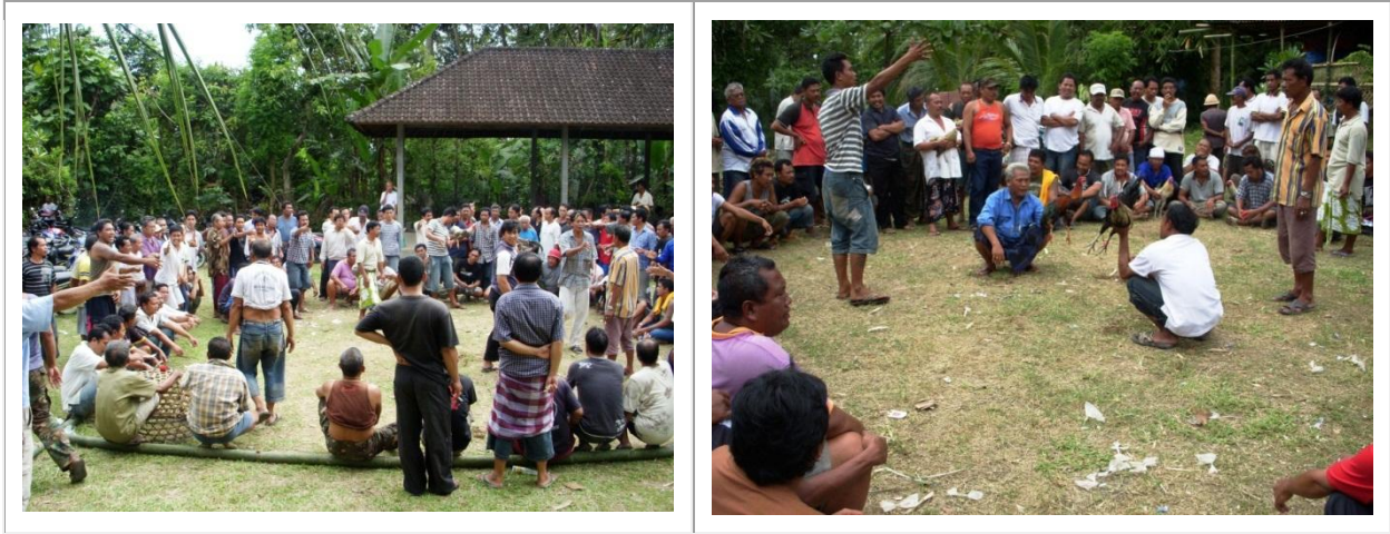
Au nord de Bali, près de Baturiti, des hommes rassemblés autour d'une arène, des coqs parés au combat et des paris en cours...

Combat de coqs et combat rock, avec jeux de grattes et folie scénique, même combat ? Sans doute, car le clash est toujours là ! L'adrénaline aussi. A Bali, comme en d'autres lieux d'Indonésie, la lutte entre gallinacés rivaux est un rituel sacré, une tradition immuable ou un passe-temps honorable, un art de vivre pour certains ou un massacre organisé pour d'autres. Niveau ambiance, le goût de l'arène du combat à Bali n'a (presque) rien à envier à celui délivré par la reine du carnaval à Rio. Il est vrai également que le climat de surchauffe qui règne durant ces parties viriles où les coqs portent bien leurs noms rappelle davantage les hordes de supporters de foot dans le stade de Maracana ou encore les fans avinés d'un concert de punk-rock en banlieue londonienne que la vie paisible dans les rizières balinaises... Le spectacle est garanti et les âmes sensibles sont priées de s'abstenir. On l'aura compris, le combat de coqs est d'abord une affaire de mecs et de tripes. De types aussi qui s'effritent par le biais de volailles peu consentantes, promises à la destruction.