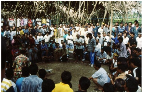
Des combats de coqs chez les Toraja, à Sulawesi-Sud