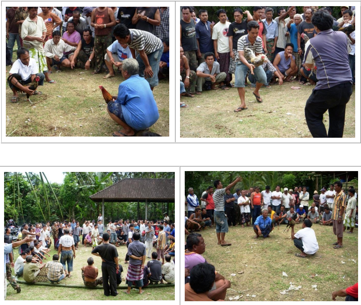
Des combats de coqs à Bali, près de Baturiti