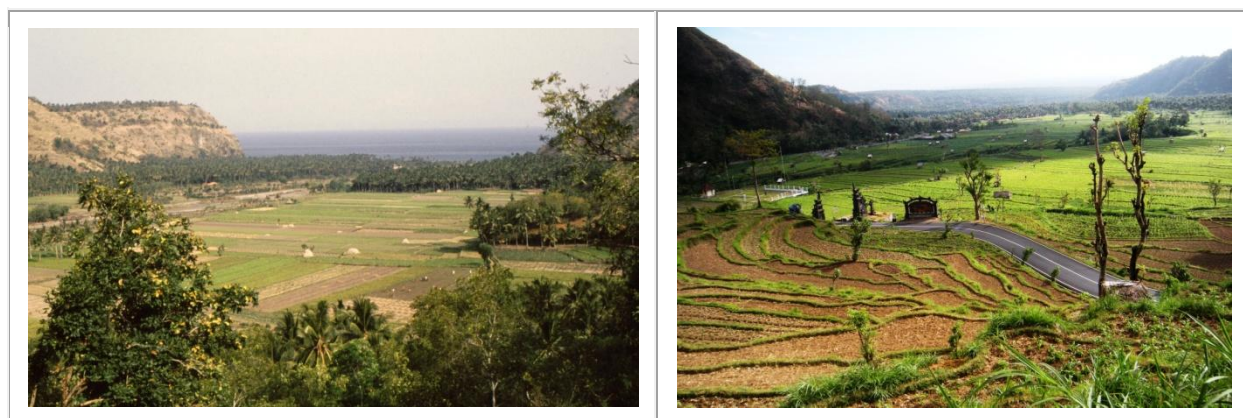
Le passage du col entre Bebandem et Amed, en 1991 et en 2012.