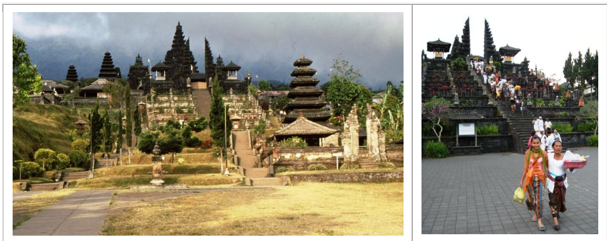
Le temple majeur de Besakih, respectivement en 1991 et en 2011.