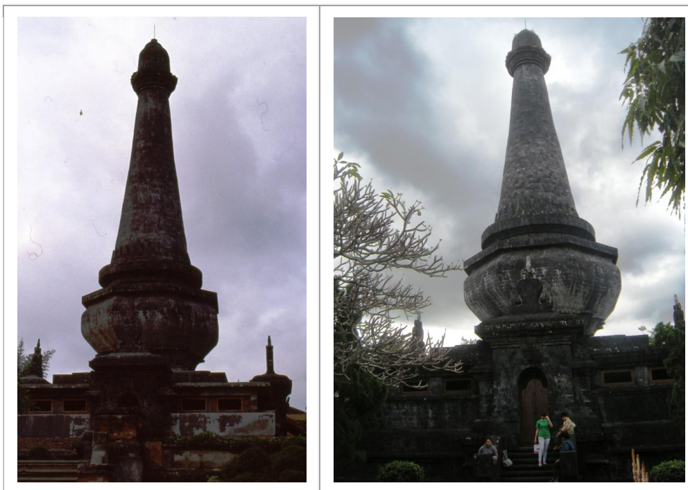
Monument commémoratif du puputan (suicide collectif et rituel, mais qui signifie également combat jusqu'à la mort) de 1908, au centre de la ville de Klungkung, en 1991 et en 2012. Ici, avec le béton, rien ne change...