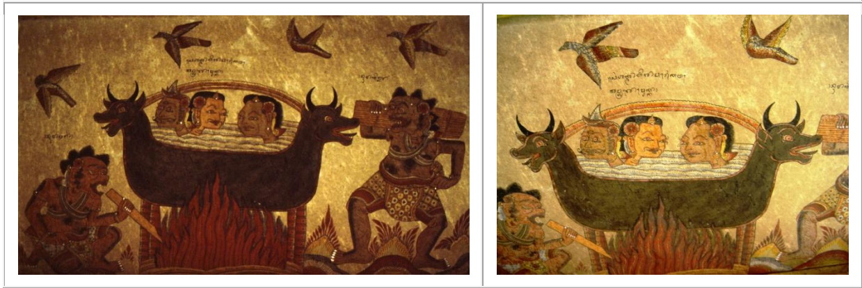
Détail des peintures murales de l'ancien palais de justice de Klungkung, en 1991 et en 2012.