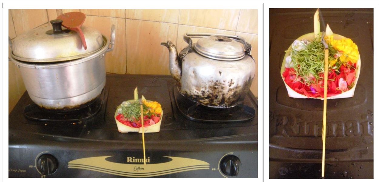
Offrande matinale, sur une gazinière, entre eux gamelles. Ou l'art local de cuisiner au milieu des fleurs...

Les défis sont pourtant innombrables. Le fait crucial que quatre millions de personnes résident, tant bien que mal, sur cette (trop) petite île constitue une véritable bombe à retardement, un défi quasi ingérable... et qu'il faudra pourtant arriver à surmonter. On pourrait commencer, drastiquement, par réduire le nombre de voitures au lieu de faire le contraire !