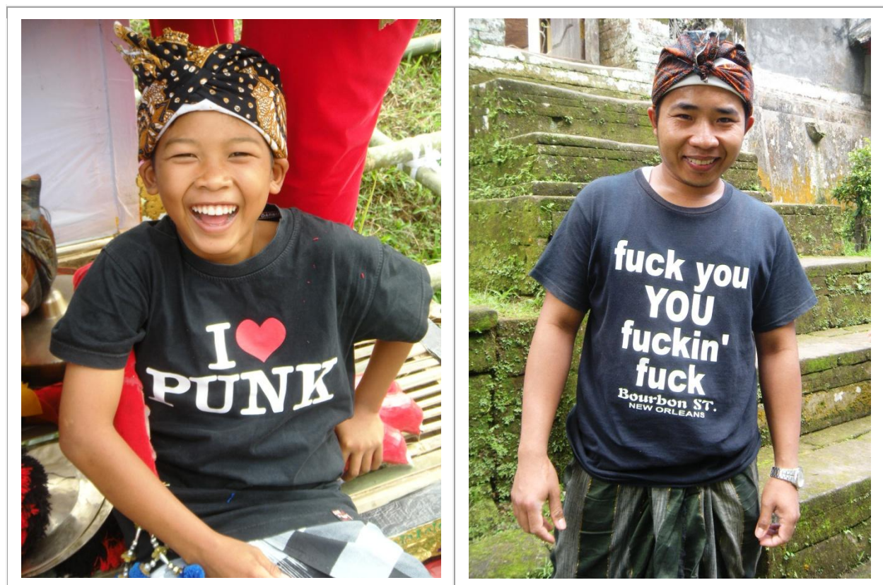
Des Ramones en particulier au punk en général il n'y a qu'un pas. Ici, en 2012, deux jeunes types dynamiques et joyeux à l'occasion d'une crémation collective à Serokadan (district de Bangli, au centre de l'île).