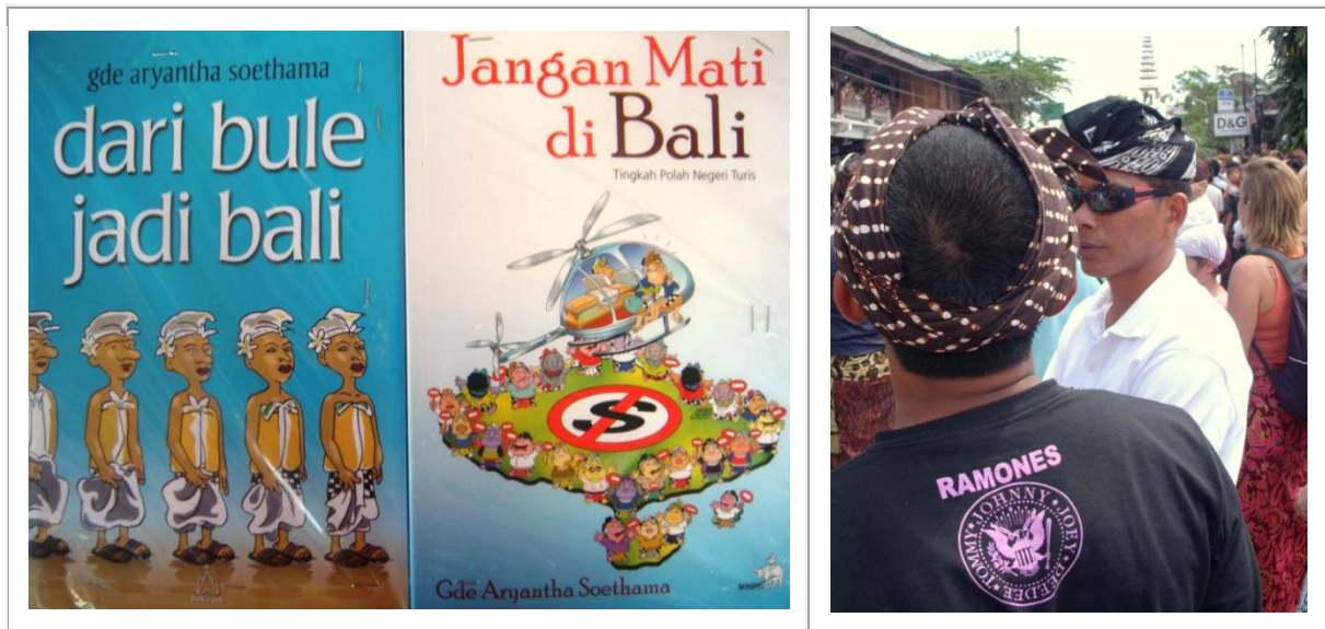
A gauche, deux couvertures de recueils de nouvelles sarcastiques et joliment moderne du journaliste balinais Gde Aryantha Soethama. Elles parlent du mélange d'occidentalisation et de culture locale à Bali. A droite, les Ramones s'invitent sur les tee-shirts des membres de l'organisation d'une crémation royale à Ubud en 2008. Il est vrai aussi qu'au loin, on voit l'enseigne de D&G, sans doute plus significative de l'évolution d'Ubud...