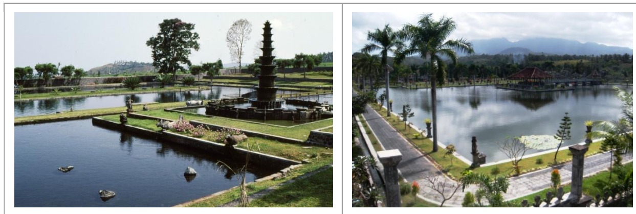
Le palais d'eau du raja de Karangasem, à Amlapura, en 1991 et en 2012.