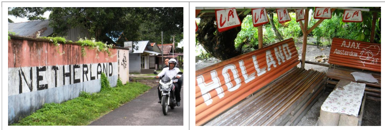
Le foot hollandais, toujours efficace pour galvaniser la foule de... supporters et de villageois chrétiens moluquois ! Ici, dans les ruelles de Kota Saparua, modeste mais principal centre « urbain » de l'île éponyme.