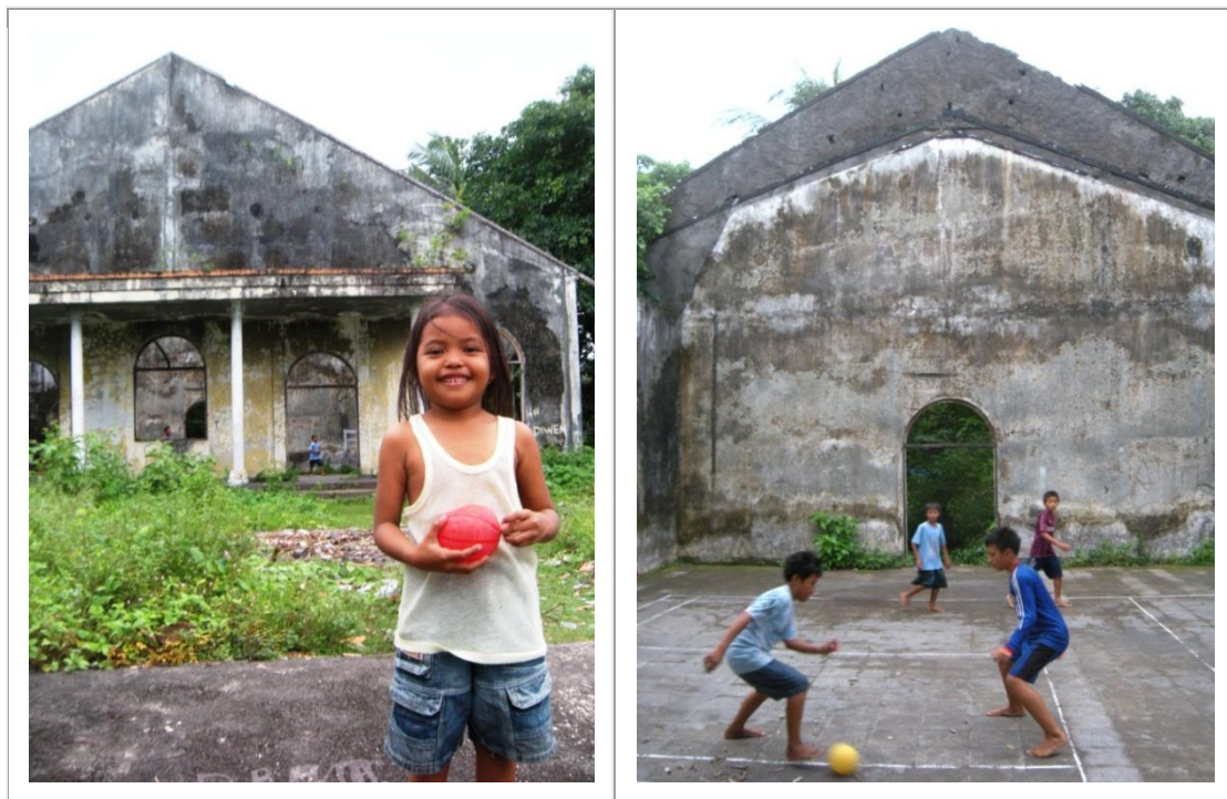
Un joli sourire, une belle petite balle rouge et au fond, les restes de l'église catholique détruite en 1999 lors des affrontements religieux à Banda Neira, principale île de l'archipel des Banda, dans les Moluques. A droite, toujours dans la même église qui a trouvé une nouvelle fonction : terrain de football pour les jeunes du village...

Au milieu du moins de juin 2012, pendant l'Euro qui se déroule en Ukraine, chaque match de la Hollande déplace son quota de supporters indonésiens. Au café Sibou-Sibu à Ambon, il est vrai très fréquenté par les habitants chrétiens de la cité, le propriétaire propose une projection publique des matches. Succès garanti. De quoi animer et distraire une ville dont le quotidien est trop souvent marqué par les seules tensions religieuses : le café reste ouvert toute la nuit lorsque la Hollande joue, un match commençant notamment à 3h45 du matin heure locale ! Et certains pensent que les Indonésiens s'en foutent du foot, il faut être fou pour y croire. La Tim Oranye a toutefois été vite disqualifiée en début de compétition ce qui, sur le plan moluquois, se traduit par certes un peu moins de folie sportive mais peut-être aussi par un peu moins de victimes en cas d'échauffourées. Bref, un mal pour un bien... Car dans l'immédiat, ce n'est pas la folie du foot qui rend fou mais, hélas, plutôt la folie religieuse. Taper dans un ballon s'avère nettement moins compliqué que de vivre ensemble. Ici comme ailleurs.