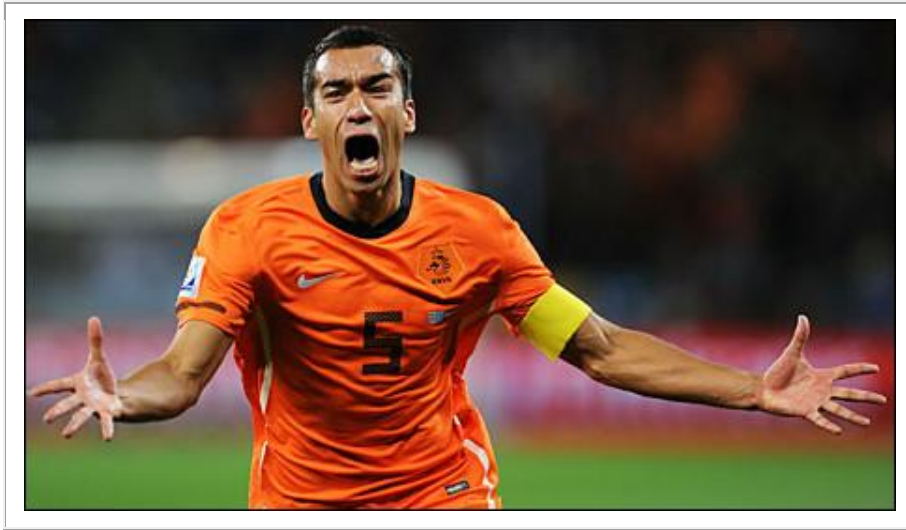
Joueur de la sélection nationale hollandaise, d'origine moluquoise, Giovanni van Bronckhorst est une fierté régionale dans toutes les Moluques, particulièrement pour les habitants de confession chrétienne.

musulmans du même archipel, qui parfois reprochent à ces supporters en orange de comploter contre eux, avec le soutien (en retour ?) des anciens colonisateurs... Juste après la finale de la Coupe de 2010, un marché d'Ambon a été mis à sac : œuvre commune de supporters et contre-supporters, tous unis dans une même colère et détestation ? La question qui demeure, y compris deux ans après le Mondial et au moment où se déroule l'Euro 2012, est : le détour « ludique » par le sport ne pourrait-il pas empêcher le recours « tragique » au clivage religieux ?