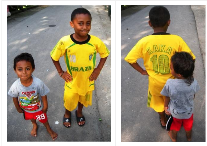
Jeunes Ambonnais, adeptes du ballon rond, avec le maillot du Brésilien Kaka sur le dos, car pour une valeur sûre en voilà résolument une, le foot venant du Brésil fait partout rêver...