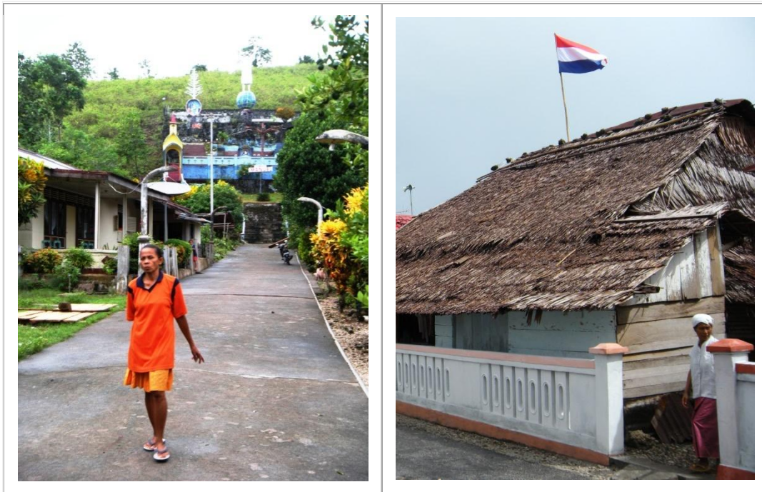
Dans les villages chrétiens de Nolloth et de Itawaka, au nord de la modeste île moluquoise de Saparua, on se croirait volontiers en Hollande, les polders en moins mais le climat tropical en plus...

Hollande... La folie du foot est capable, momentanément seulement, de mettre en veilleuse tous les différends, toutes les haines... Dommage que cela ne dure pas.