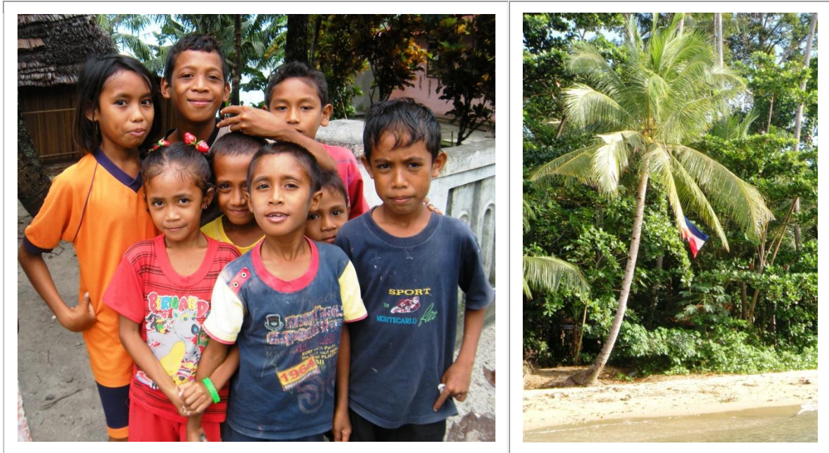
Enfants de Saparna... et un palmier aux couleurs des Pays-Bas à Seram, le tout dans les Moluques.

Il est incontestablement un sport européen, également « colonial », qui dans l'Histoire aura connu un destin exceptionnel : le football... A l'exception notable de l'Amérique du Nord, partout ce jeu collectif d'affrontement se répand en étalant sa philosophie simpliste mais apparemment efficace : « gagner impérativement et pour cela toujours être le meilleur ». L'objectif est clair et précis, il s'agit de courir après un ballon et de battre l'adversaire en lui marquant le plus de buts possible. Un jeu au demeurant très agréable ce qui ne fait qu'augmenter son engouement. C'est simple donc mais pas toujours très sportif, il suffit de voir les conflits, bastons et bastonnades, qui parfois accompagnent certaines tribunes ou pimentent certains matches. Si par conséquent le jeu peut s'avérer plaisant il n'est pas nécessairement du meilleur goût pour tous. Surtout lorsqu'au jeu se mêlent politique et religion.