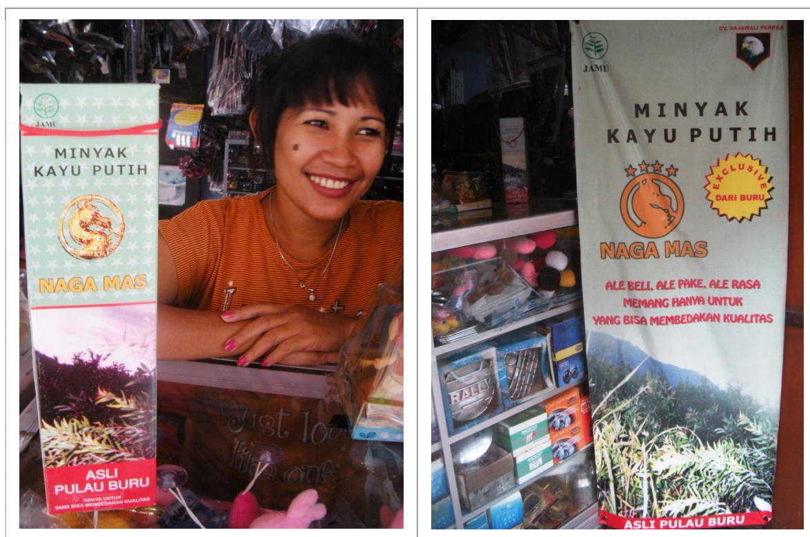
L'or est partout, comme à Ambon, à deux pas du port. Ici c'est la marque Naga Mas (dragon d'or) qui propose la vente d'une huile médicinale de haute qualité, fabriquée sur l'île de Buru, à partir du bois d'eucalyptus.

Voilà qui n'est pas trop mal dit ni trop mal pensé, mais comment endiguer les flux massifs des fous de l'or ? Il faudra sans doute patienter jusqu'à ce que la source du précieux métal jaune soit tarie ou bannie pour que le reflux des chercheurs d'or puisse véritablement s'opérer. Ici comme ailleurs, d'autres filons, toujours aurifères et parfois mortifères, surgiront et propulseront les hommes sur la voie de la folie.